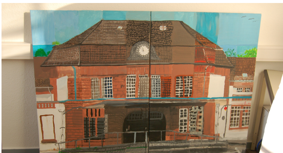
Der Dieringhauser Bahnhof wurde gestaltet von rund 40 Menschen aus der Region. Nun wurde er an die Investorengruppe übergeben.

„Dieses Bahnhofsbild ist als Gemeinschaftswerk entstanden“